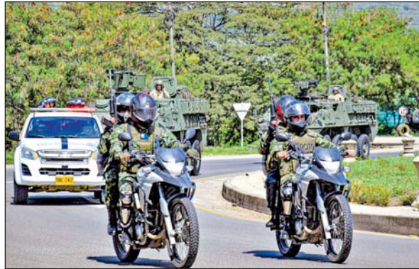
EL GRUPO antiterrorista de la Policía de Nueva York asesorará las tácticas antiterrorismo de la Policía Nacional en Cali para la cumbre.